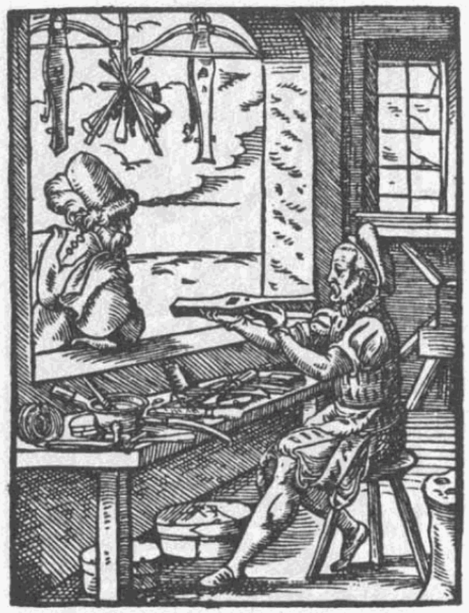
Abb. 166 | Armbrusterstellung um 1480

Moderne Armbrüste: Die Spannleistung konnte durch geringeres Zuggewicht stark verbessert werden. Pfeilgeschwindigkeiten von über 400 km/h sind heute möglich.