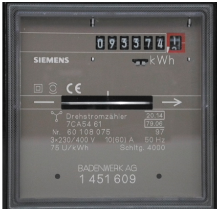
Abb. 262 | Elektrische Energie wird in kWh (Kilowattstunden) gemessen. Kilowattstunden basieren auf Wattsekunden (Ws): 1 \text{ kWh} = 1 \times 1000 \times 1 \text{ W} \times 3600 \text{ s} = 3\,600\,000 \text{ Ws} Kilowattstunden sind praktisch im Alltag, haben aber den Nachteil, dass die hineingerechneten Stunden nicht dezimal sind. Wattsekunden dagegen eignen sich besser für Berechnungen in der Physik, insbesondere wenn verschiedene Einheiten ineinander umgerechnet werden, denn: 1 \text{ Wattsekunde} = 1 \text{ Joule} = 1 \text{ Newtonmeter} oder 1 \text{ Ws} = 1 \text{ J} = 1 \text{ Nm} .