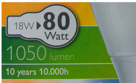
Abb. 263 | Die Angaben auf der Verpackung von Leuchtmitteln beziehen sich auf deren Leistung bzw. auf die Energie, die sie in einer Sekunde konsumieren. Lumen ist ein Mass für die Helligkeit der Lampe.

Die Anwendung von Nm oder \text{kgm}^2 / \text{s}^2 ist sinnvoll und nachvollziehbar für mechanische Energie. Bei anderen Energieformen wie Wärme oder Elektrizität dagegen ist dies nicht so naheliegend. So wurden für andere Energieformen andere Einheiten vorgeschlagen, insbesondere das Joule (kurz: J, ausgesprochen «Tschuul») für Wärme und chemische Bindungsenergie und die Wattsekunde für die Elektrizität. Wattsekunde und Joule sind aber immerhin so festgelegt, dass sie die gleiche Menge an Energie bezeichnen. So gilt: