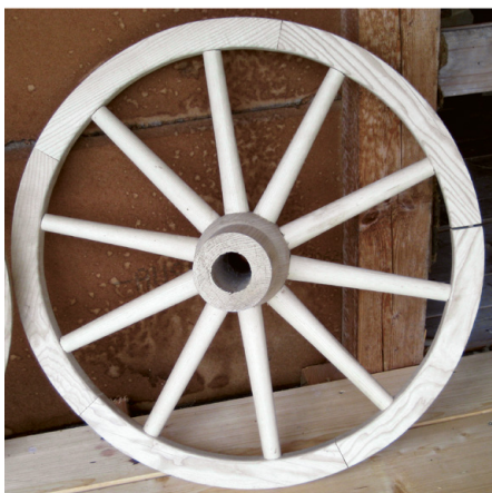
Abb. 244 | Entwicklung vom Scheibenrad zum Speichenrad