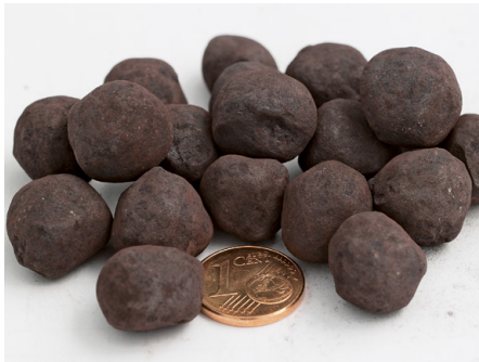
Abb. 37 | Eisenerzpellets für die Stahlproduktion

Beim «Frischen» wird das flüssige Roheisen aus dem Hochofen abgestochen und in einen grossen Schmelztiegel (Konverter) gefüllt. Eisen- und Stahlschrott sowie Eisenschwamm werden dazugegeben. Unter hohem Druck wird nun reiner Sauerstoff in den Schmelztiegel geblasen. Der im Roheisen enthaltene Kohlenstoff und die anderen unerwünschten Stoffe reagieren mit dem Sauerstoff und werden dabei verbrannt. Das Endprodukt ist ein schmiedbarer Stahl. Durch Zugabe von weiteren Stoffen (das sogenannte Legieren) können die Eigenschaften des Stahls weiter verbessert werden.