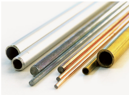
Abb. 39 | Verschiedene Handelsformen von Metallrohren